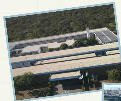
Campus Planaltina - FUP

A Universidade de Brasília é multicampi desde 2006, quando foi inaugurada a Faculdade UnB Planaltina (FUP) , a primeira fora do Plano Piloto. Dois anos depois, as faculdades de Ceilândia (FCE) e do Gama (FGA) foram inauguradas e passaram a receber seus estudantes, professores e técnicos. Os campi têm vocação própria e já se tornaram referências em graduação e pós-graduação.