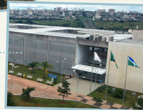
Campus Ceilândia - FCE