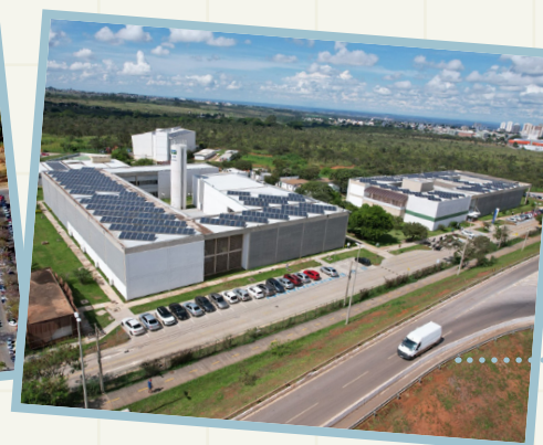
Campus Gama - FGA