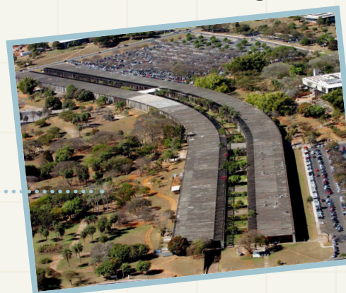
Campus Darcy Ribeiro